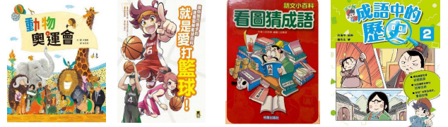
不同時段在閱讀區展出的圖書(部分)