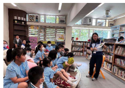
同學們聚精會神地聆聽家長義工分享故事！