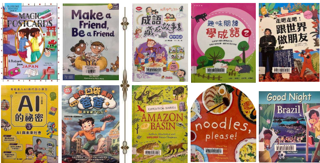
圖書館新購的圖書(部分)

為增加圖書館的藏書量，讓學生有更多選擇，吸引學生閱讀，圖書館除了購買新書外，還向公共圖書館借出了中、英文圖書共300本。圖書主題包括與地理及旅遊有關的中、外名勝古蹟，與飲食有關的世界各地飲食文化，還有不少趣味成語故事。歡迎各位同學帶智能卡到圖書館借閱。