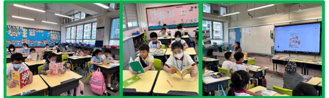
早讀時，同學都拿起圖書，認真閱讀。還有班主任帶領同學一起共讀呢！

配合早晨閱讀，鼓勵同學每天帶圖書回校，於餘暇時間閱讀。鼓勵大家逢星期二、四帶英文圖書，或在校內放置中、英文圖書，並於開學後更換新的，同學也可到圖書館借書。