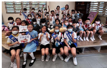
聽完故事，大家還收到家長精心製作的「糖果」！