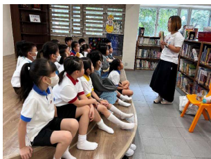
同學正在專心聆聽家長說故事。